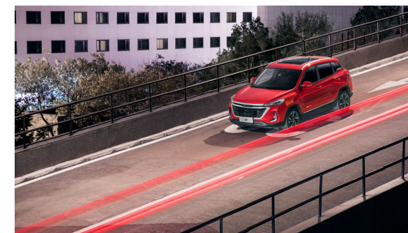
ABS, EBD, ESP