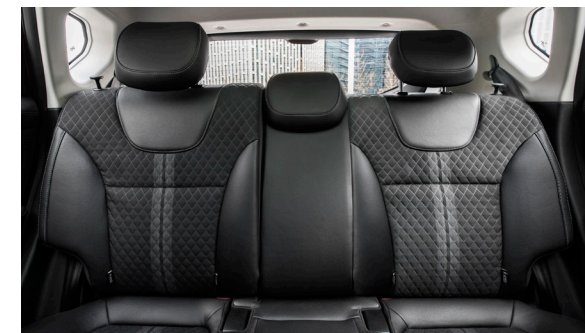
Fotele materiałowe z łączeniami ze sztucznej skóry