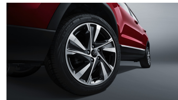
17-calowe dwukolorowe felgi aluminiowe