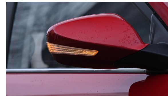
Lusterka zewnętrzne z kierunkowskazami