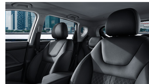
Miękkie tworzywa we wnętrzu