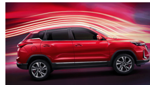
Asystent podjazdu HHC