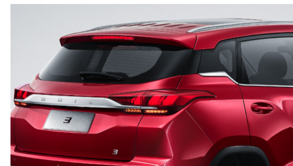
Srebrne relingi ozdobne