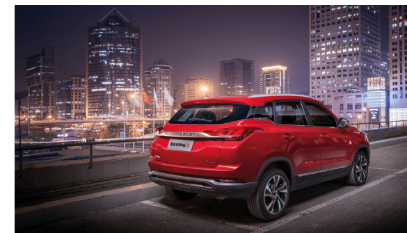
Czujniki parkowania i kamera cofania z dynamicznymi liniami pomocniczymi.